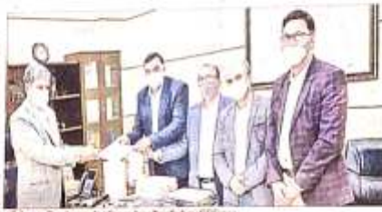
सिंहभूम चेंबर ऑफ कॉमर्स व इंडस्ट्रीज के प्रतिनिधिमंडल ने मुख्य सचिव, पर्यटन, भूमि राजस्व सचिव व उद्योग निदेशक से मिला प्रतिनिधिमंडल को एक रोड मैप सौंपा।

बिहड़ूर चेंबर ऑफ कॉमर्स व इंडस्ट्रीज का एक प्रतिनिधिमंडल मुख्य सचिव, पर्यटन, भूमि राजस्व सचिव व उद्योग निदेशक से मिला प्रतिनिधिमंडल को एक रोड मैप सौंपा।