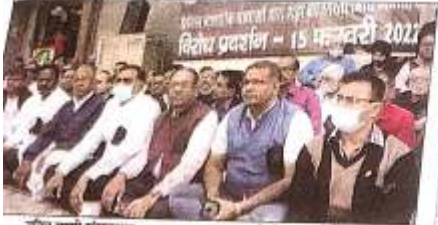
विजय चैम्बर संघर्षदायक पत्र : शहर के प्रमुख व्यापारिक संगठनों ने जमशेदपुर में 32 लाख रुपये की लूट के मामले को लेकर विजय चैम्बर ऑफ इंडस्ट्रीज और शहर के विभिन्न व्यापारिक संगठनों ने अलग-अलग पत्र भेजे हैं। शहर के प्रमुख व्यापारिक संगठनों ने जमशेदपुर में 32 लाख रुपये की लूट के मामले को लेकर विजय चैम्बर ऑफ इंडस्ट्रीज और शहर के विभिन्न व्यापारिक संगठनों ने अलग-अलग पत्र भेजे हैं।