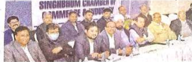
चैंबर भवन में आनलाइन मार्केटिंग पर आयोजित सेमिनार में शामिल लोग