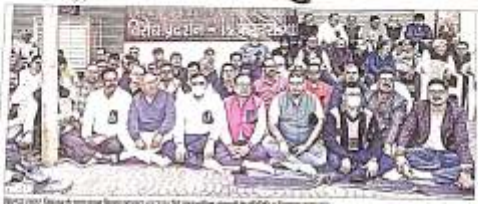
शहर की गिरी लूट-व्यवस्था के खिलाफ व्यापारियों ने किया विरोध प्रदर्शन, कहा 72 घंटे में लूट कांड का खुलासा करे पुलिस