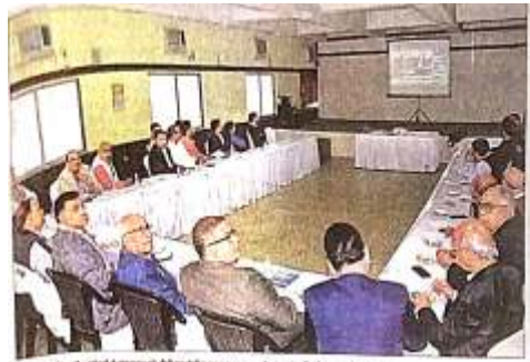
केंद्रीय कजट को लौहगरी के व्यापारियों और उद्यमियों ने महारकाबी बताया, कस

नोटिस देने से पहले विभाग अपने पास उपलब्ध डाटा का गहन अध्ययन करे एवं जिन मामलों में गड़बड़ी मिले, सिर्फ उन्हीं मामलों में नोटिस भेजा जाए। इसपर एडिशनल कमिश्नर ने बताया कि डीजीआरएम नई दिल्ली द्वारा दी गई जानकारी के आधार पर ही व्यवसायियों को नोटिस दिया जा रहा है। हालांकि उन्होंने विश्वास दिलाया कि व्यवसायियों को इसको लेकर ज्यादा परेशान होने की आवश्यकता नहीं है। व्यवसायी सही आंकड़ों के आधार पर नोटिस का जवाब दें।