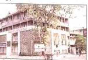
छापेमारी की गई, पुलिस शहर में निगरानी कर च अपने अपराधियों पर पकड़ रखे हुए है। मामले के अद्वैत के लिए गजराज मेंशन सीमा बन्द की गई है। शहर में सड़क-परिदृश्य से पूरा घेरे-घेरे की जा जा रही है।

विजय चैम्बर और शहर के बैंकों में लगे सीसीटीवी कैमरे बंद हो चुके हैं। शहर में 32 लाख रुपये की लूट के मामले में कई जगहों पर छापेमारी की जा रही है। पुलिस शहर में निगरानी कर च अपने अपराधियों पर पकड़ रखे हुए है। मामले के अद्वैत के लिए गजराज मेंशन सीमा बन्द की गई है। शहर में सड़क-परिदृश्य से पूरा घेरे-घेरे की जा जा रही है।