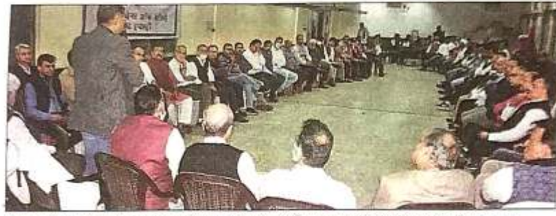
सोमवार को बिहड़ूर में लूट की घटना के बाद चेंबर भवन में जार्त करते सिंहभूम चेंबर ऑफ कॉमर्स के पदाधिकारी।

को गिरती विधि व्यवस्था पर चरपरबद्ध तरीके से आंदोलन चलाने का निर्णय लिया गया। इसी क्रम में मंगलवार दोपहर 12 बजे से दोपहर 1 बजे तक बिहड़ूर छगनलाल चौक पर व्यवसायी काला बिल्ला लगाकर विरोध प्रदर्शन करेंगे।