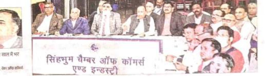
सिंभूम चैंबर ऑफ कॉमर्स एंड इंडस्ट्री

सिंभूम चैंबर ऑफ कॉमर्स के बिट्टपुर स्थित भवन में चैंबर के प्रतिनिधियों ने वित्तमंत्री द्वारा पेश किये गये बजट का सौधा प्रस्ताव देखा, बजट में सरकार द्वारा की गयी घोषणाओं पर संयत किया, चैंबर को सामूहिक प्रतिक्रिया गरी कि बजट आम जनता को उम्मीदों पर खरा उतरा है, लेकिन व्यापारियों को कुछ निराशा हाथ लगी है, उम्मीद थी की उद्यमियों को केंद्र सरकार को तरफ में बड़ा लोहाप मिलेगा, जो नहीं मिला, टैक्स सौधा करने की उम्मीद को लेकिन ऐसा नहीं हुआ, दो साल टैक्स रिवाइज में सुट प्रदान कर सरकार ने बड़ी गलत प्रदान की है.