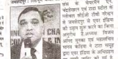
चैबर ने जमशेदपुर से एयर इंडिया को उड़ान शुरू करने का अनुरोध किया