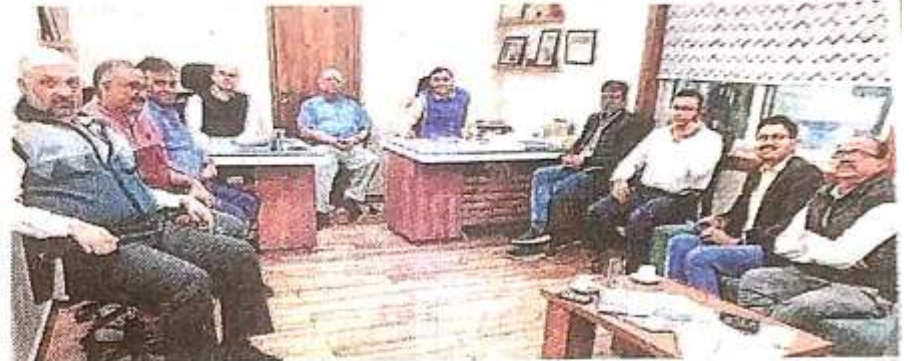
शहर की बिगड़ी विधि-व्यवस्था पर चैंबर भवन में चर्चा करते पदाधिकारी।