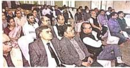
सिंहभूम चैंबर ऑफ कॉमर्स एंड इंडस्ट्री के सेमिनार में शामिल लोग

वार्षिक आय 2.50 लाख रुपये से अधिक है तो भी अनिवार्य रूप से करना होगा रिटर्न फाइल