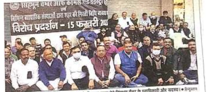
मानांतर की बिष्टुपुर स्थित अमलनाथ चौक पर लूट के खिलाफ धरना देते सिंहभूम चैबर के पदाधिकारी और सदस्य।

सिंहभूम चैबर सिंहभूम चैबर ऑफ कॉमर्स एंड इंडस्ट्री के प्रतिनिधिमंडल ने जमशेदपुर में लूट के खिलाफ काला बिल्ला लगाकर प्रदर्शन किया।