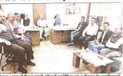
चैम्बर अध्यक्ष व बैठक करते ज्वेलर्स एसोसिएशन व चैम्बर के सदस्यों