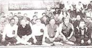
शहर के व्यापारियों ने पुलिस के अभाव में रात के लूटने का मामला बढ़ रहा है और व्यापारियों को सुरक्षा के अभाव में परेशानी हो रही है।

श्री 32 लॉन्ग लॉट अट बाइपास जम्मू शहर के बाइपास पर हुए एक रात के लूटने के मामले में पुलिस के अभाव में शहर के व्यापारियों ने गहरी चिन्ता व्यक्त की है। उन्होंने कहा कि शहर में रात के लूटने का मामला बढ़ रहा है और व्यापारियों को सुरक्षा के अभाव में परेशानी हो रही है।